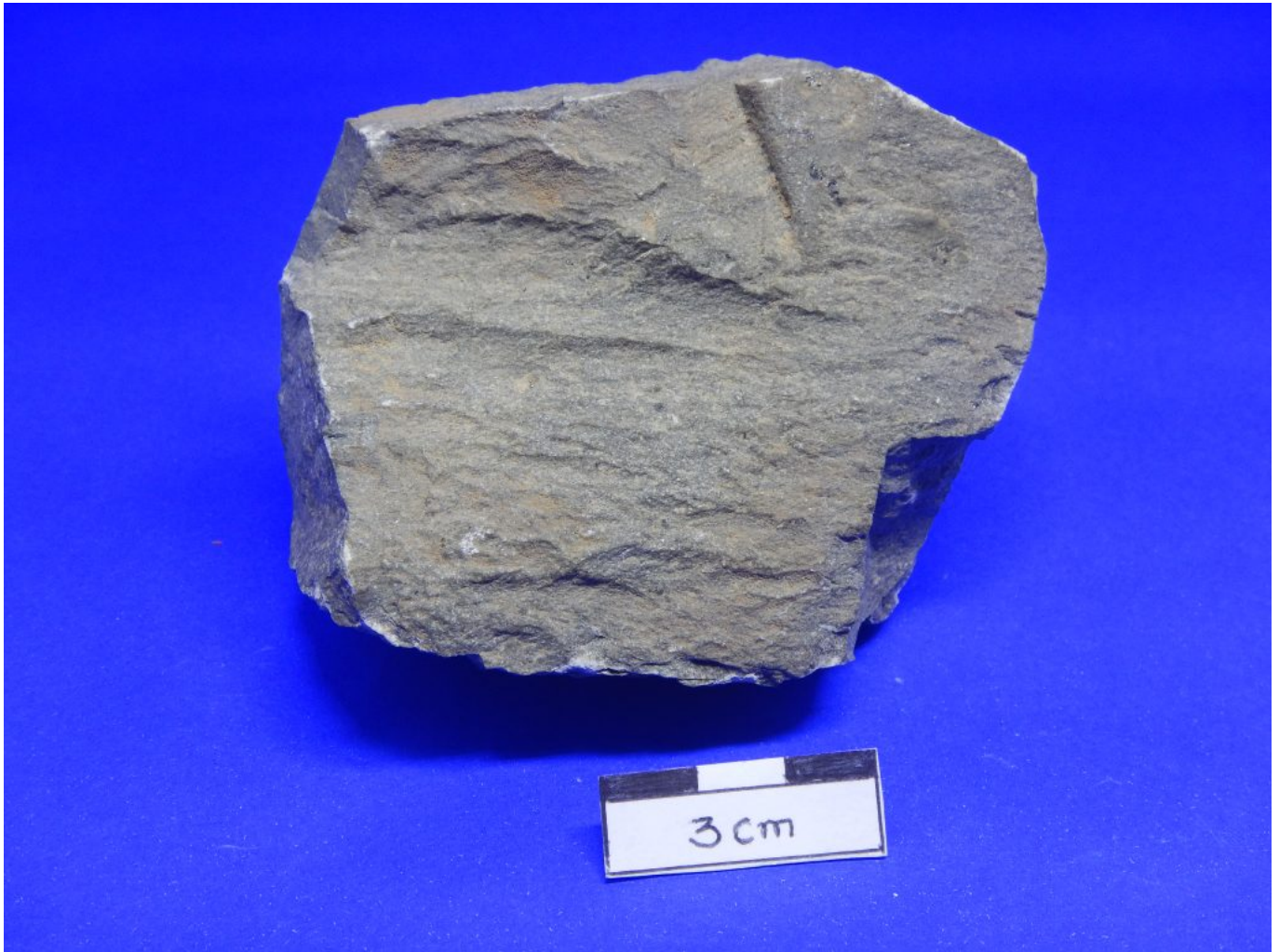
1. (FN21) traquito porfirítico com matriz fluidal.

http://gmga.com.br/12-traquito-porfirítico-formacao-remédios/