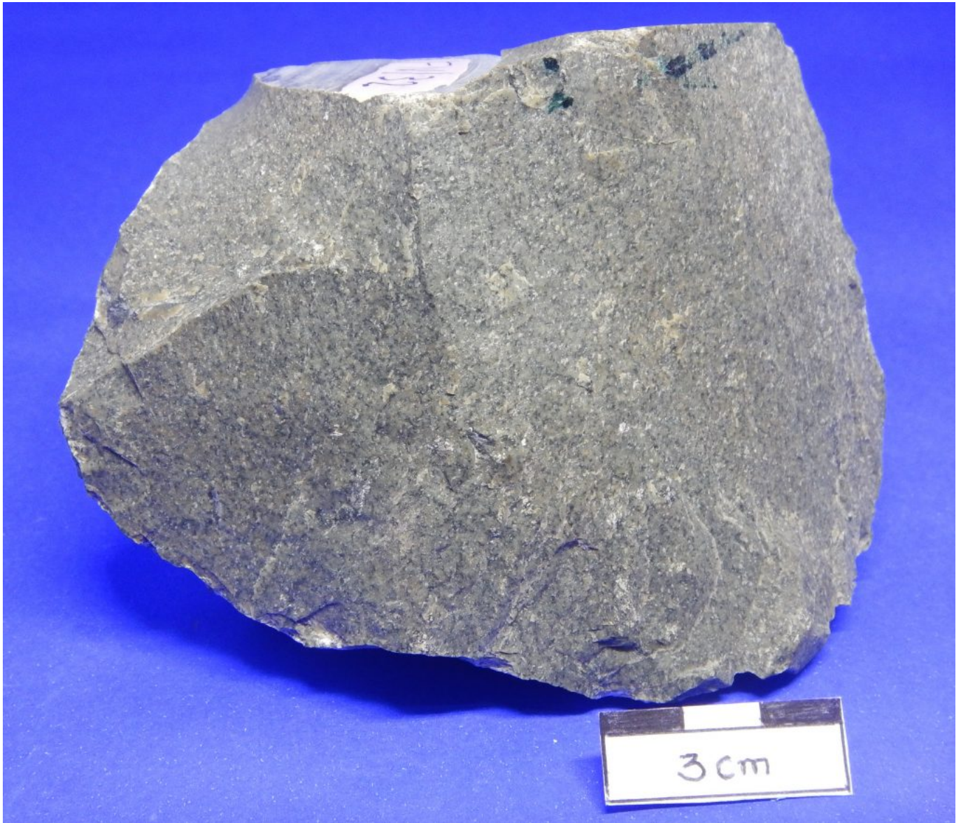
1. (FN32) sodalita-nesfelina fonolite porfirítico