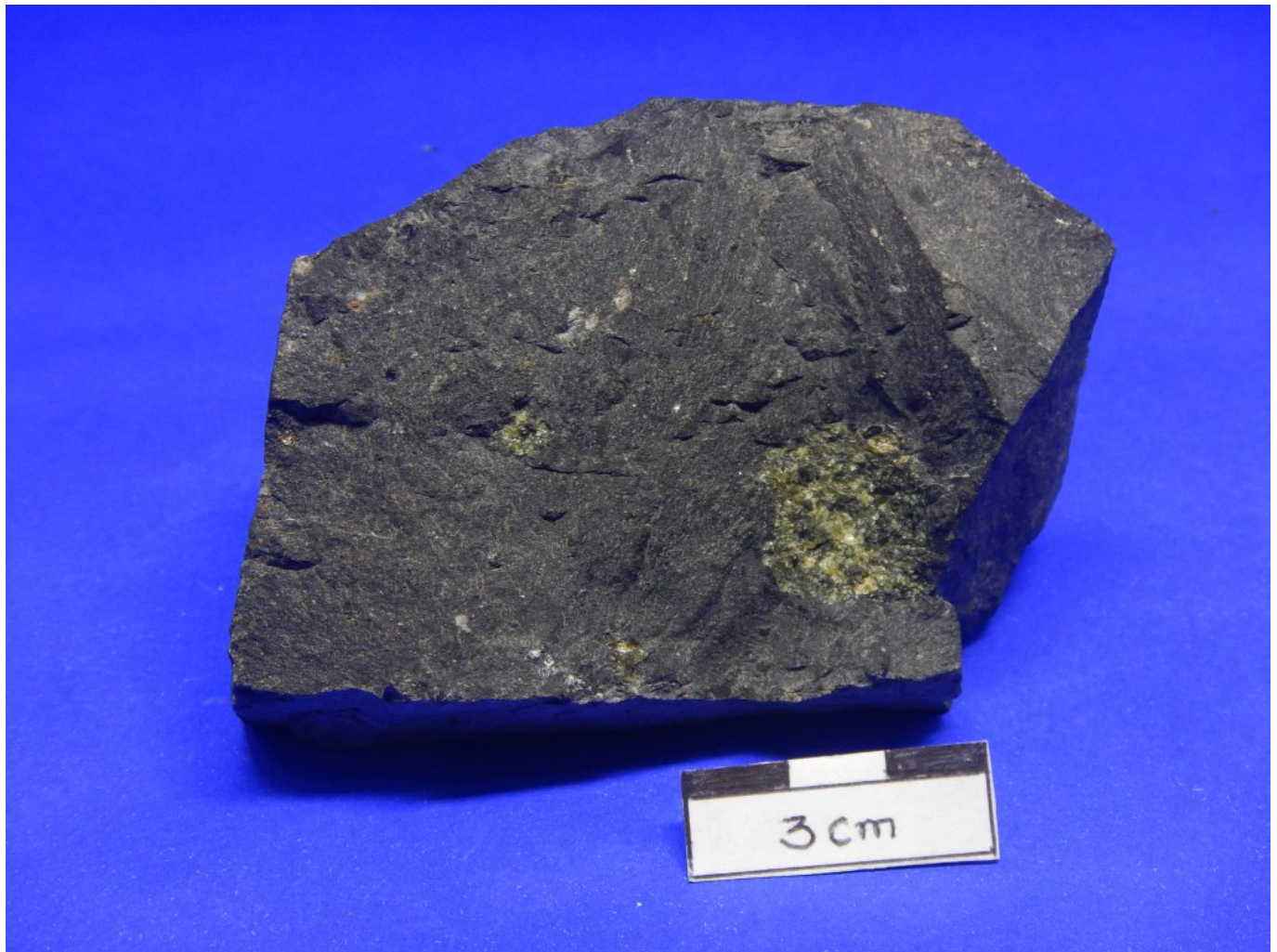
1. (FN-SJ-1) olivina basalto com aglomerado de cristais de olivina

http://gmga.com.br/06-olivina-basalto-formacao-sao-jose/