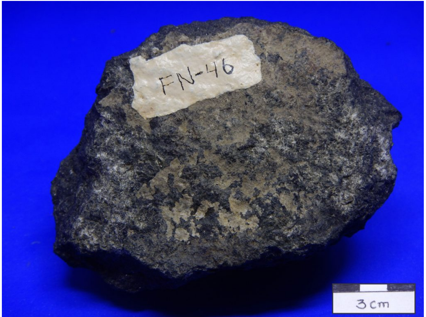
1. (FN46) dique microgabro

http://gmga.com.br/03-microgabro-dique-da-formacao-remedios/