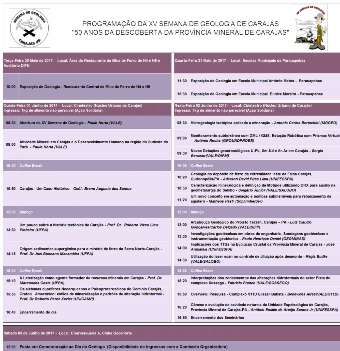
Figura 1. Programa do Ciclo de Palestra transcorrido durante a 15ª. Semana de Geologia de Carajás.