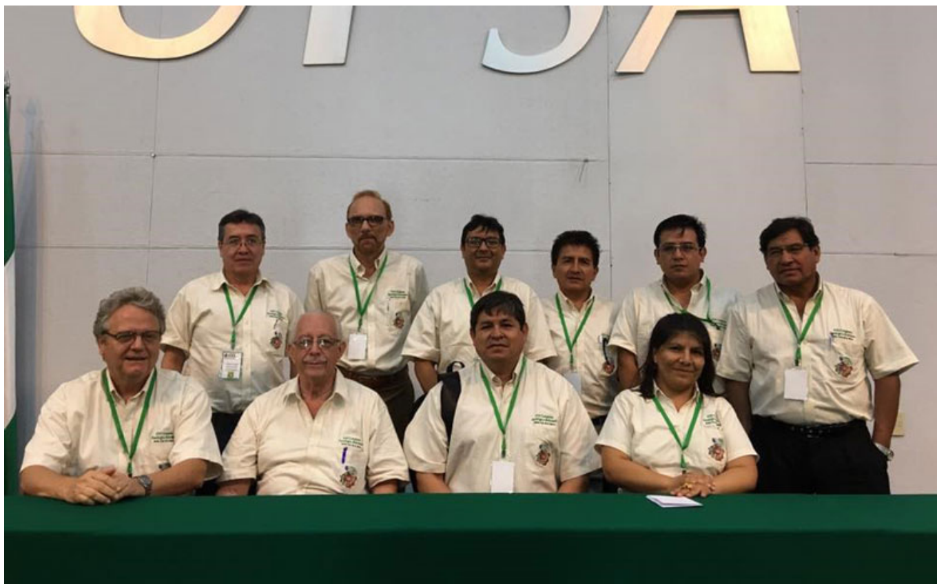
Figura 2. Comité Organizador del XXII Congreso Geológico Boliviano.