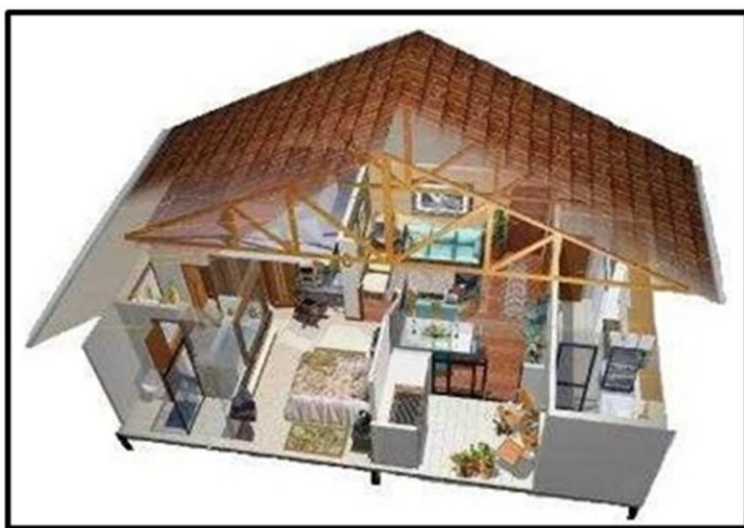
Figura 1- Modelo lúdico e pedagógico “sua casa vem da mineração” que serviu de base para a maquete do Museu de Geociências do IG-UFPA-MUGEO. ( www.mineropar.pr.gov.br ).

fiação elétrica, geladeira, rádio, torradeira, lâmpada, guardanapos, toalhas, roupa, sabonete e pasta de dente, bem como janela, tigela de cereais, copo do suco, xícara de café e talheres, todos possuem na sua composição alguma substância mineral. Os minerais participam das nossas vidas de diversas maneiras todo dia. Sem eles não teríamos todo o conforto que usufruímos nos dias de hoje. As substâncias minerais são usadas na construção de casas e edifícios. Mesmo as casas construídas em madeira, possuem vários elementos feitos com produtos de origem mineral. Encontramos minerais desde o porão até o sótão. Desta forma, este trabalho visa apresentar conceitos simples de aplicação da mineração com o uso de maquete para exposição.