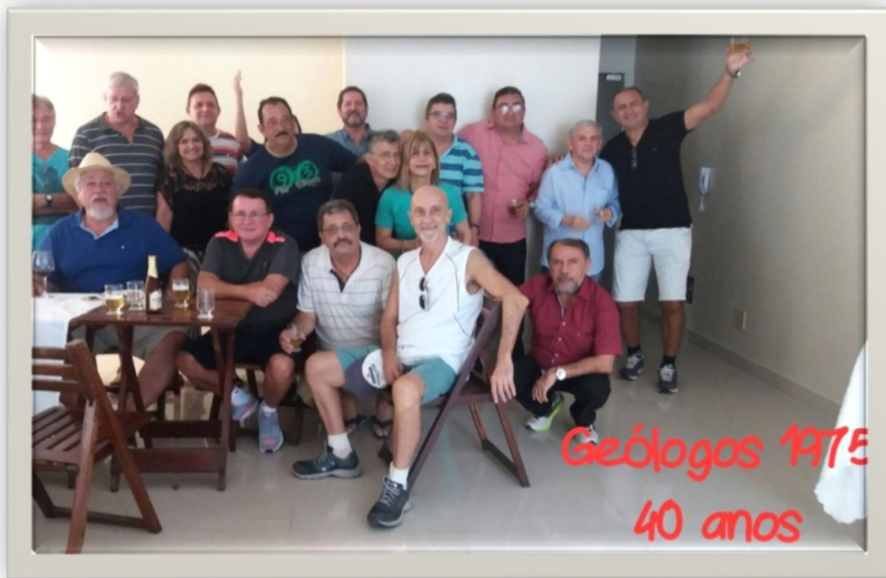
OS GEÓLOGOS FORMADOS EM 1975 REUNIDOS EM DEZEMBRO DE 2015, 40 ANOS DEPOIS.