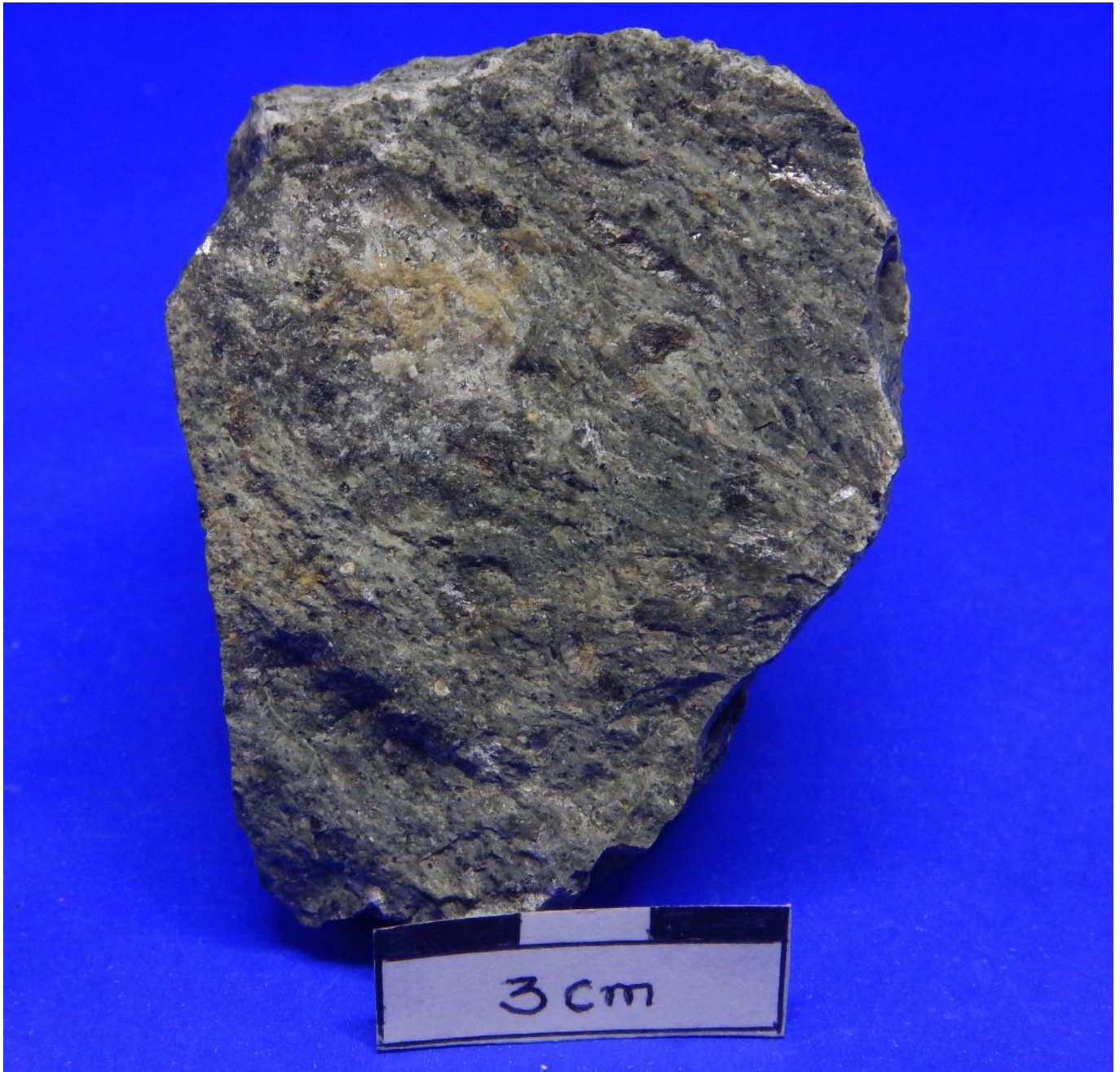
1. (FN51) nefelina-sodalita fonolito porfirítico com amígdala de zeólita e epidoto